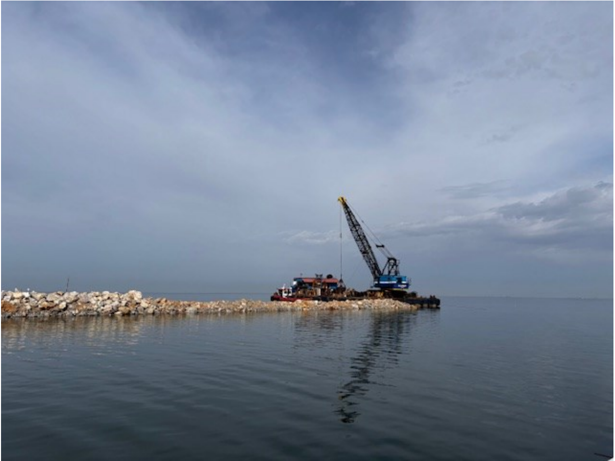
Εικόνα 5. Κατασκευή κυματοθραύστη